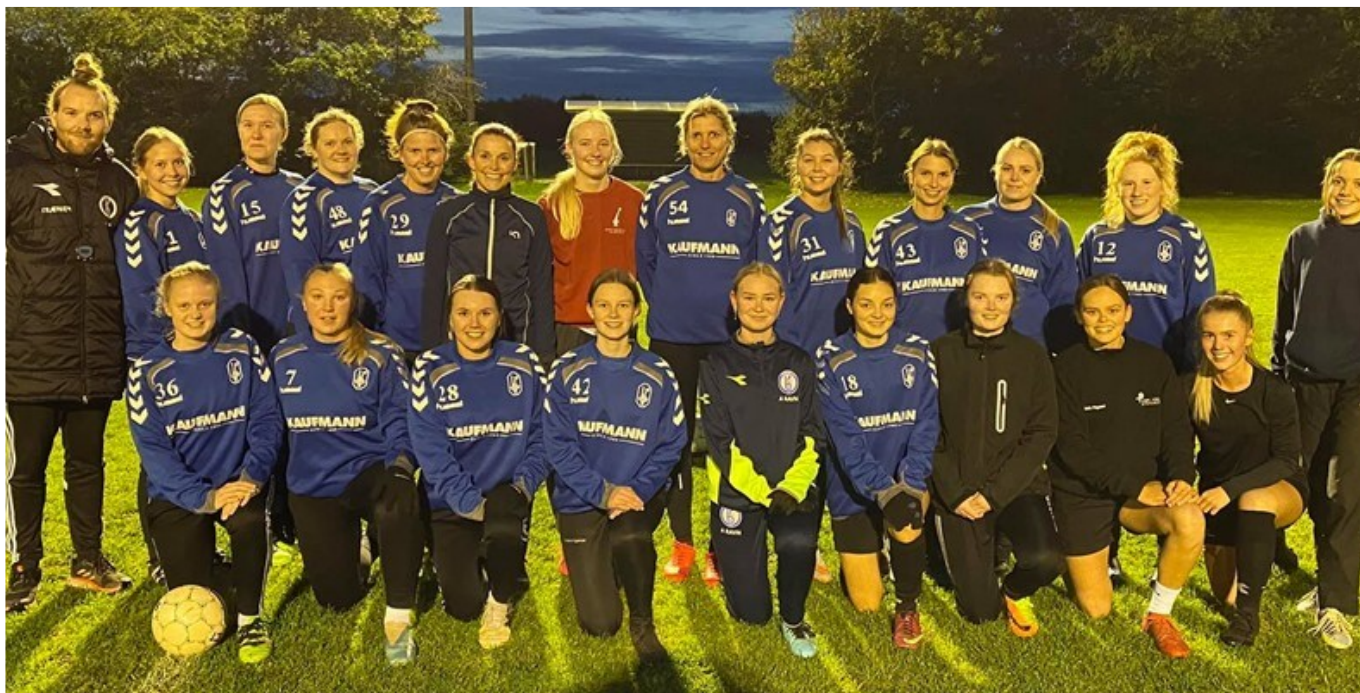
Ikke mindst opstarten af en ny afdeling for kvindelige spillere har gjort gavn i Bording IF, og denne trup endte efteråret med at spille sig op i serie 1.

I en tid, da mange klubber er i kamp for at holde gejst, motivation og ikke mindst medlemstallet oppe i seniorafdelingerne, da er Bording IF lidt øst for Ikast en succeshistorie.