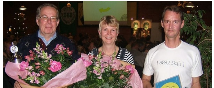
Prisvindere fra DBU Jylland Region 2 i 2009. Arkivfoto

en tur for to (modtager + ægtefælle/samlever) til udlandet - så vidt muligt til en af det danske landsholds udekampe.