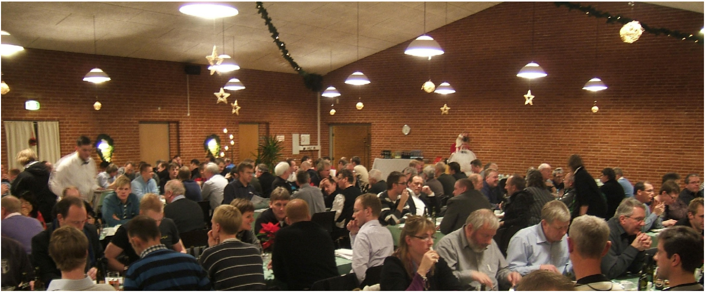
Julestemning og årsmøde i Aulum Fritidscenter november 2010

Så er der igen gået et år, og det er tid til årsmøder i de fire regioner i DBU Jylland.