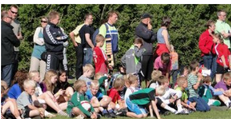
Der er fin opbakning til ungdomskampe - her til Ikast Cup i 2010.

RIF har en solid ungdomsafdeling med omkring 200 aktive, heraf ca. 150 drenge. Specielt pigesiden får ord med på vejen fra JKH. - For blot to-tre år siden havde vi ikke mange pigespillere, men vi har med stor succes afholdt "Pigeraketten" de seneste år. Det har betydet en stor stigning på den front. Derudover har vi afholdt DBU's Mikro-Fodboldskole, og i al beskedenhed var vi en af de